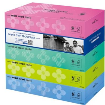
プロジェクト告知商品イメージ

「ネピア 千のトイレプロジェクト／第 12 フェーズ」では、2019年11月1日(金)から2020年1月31日(金)までの3ヶ月間、プロジェクト告知商品を日本全国で数量限定販売いたします。告知商品のパッケージには写真家・小林紀晴氏の写真を起用し、販売店様のご協力のもと、店頭を通じた告知活動を行い、世界の「水と衛生の問題」への関心を高め、理解を深めることに努めてまいります。キャンペーン期間中の対象商品の売上の一部で、ユニセフの「水と衛生に関する支援活動」をサポートし、アジアで一番若い独立国である東ティモールを支援対象国として、屋外排泄の根絶を目指します。