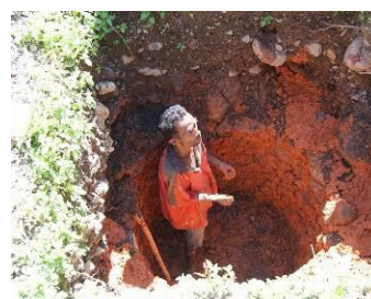
住民主導でのトイレ建設