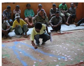
屋外排泄の根絶を促す啓発活動

衛生意識向上の活動に基づき、村を挙げた自発的なトイレづくりで、上記の基準を満たした村が、政府関連機関の認証のもと、屋外排泄の根絶宣言を行います。