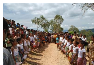
ODF（屋外排泄根絶）宣言セレモニー