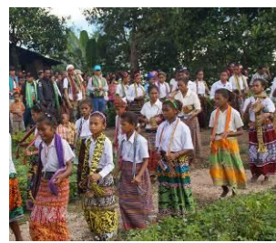
ODF（屋外排泄根絶）宣言セレモニー