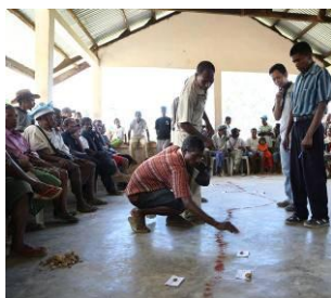
屋外排泄の根絶を促す啓発活動

（注1） 屋外排泄の根絶 ：村の全世帯、全公共施設に改善されたトイレへのアクセスがあり、住民全員がトイレを使用していること。また、村に屋外排泄の形跡がないこと。 衛生意識向上の活動に基づき、村を挙げた自発的なトイレづくりで、上記の基準を満たした村が、政府関連機関の認証のもと、屋外排泄の根絶宣言を行います。