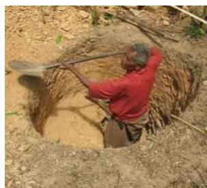
住民主導でのトイレ建設