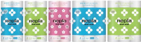
12ロールシングル/ダブル/ダブル桜