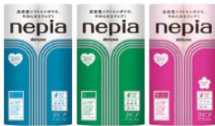
12ロールシングル/ダブル/ダブル桜